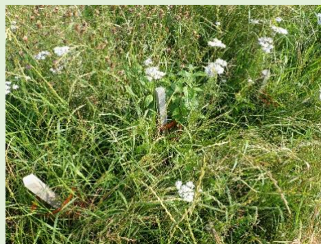
Photo ci-dessous : zone témoin sans couvert et sans dégagement (arbustes noyés dans les adventices).

NB : l'implantation d'un couvert herbacé nécessite idéalement un dégagement dans le courant du mois de septembre.