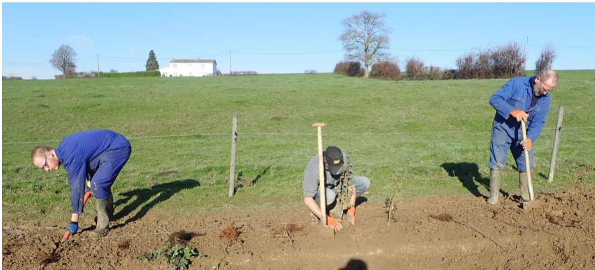
Photo : les plants sont posés sur la ligne de plantation juste avant d'être plantés, les autres restent dans la benne sous une bâche en attendant, cela évite leur dessèchement.

Une bonne plantation implique des plants frais de qualité, une mise en terre soignée et une phase d'entretien. Cette dernière est obligatoire si on veut réussir sa plantation : il convient de limiter la concurrence des adventices (« mauvaises herbes ») et de protéger ses plants contre les dégâts des animaux.