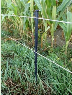
Protection électrique globale 2 fils