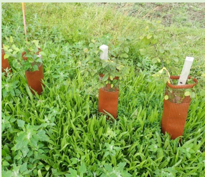
Photo de gauche : couvert de plantain lancéolé et protections individuelles pour vigne.